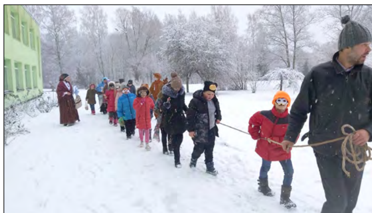
Blūka vilkšana Skujenes pamatskolā.