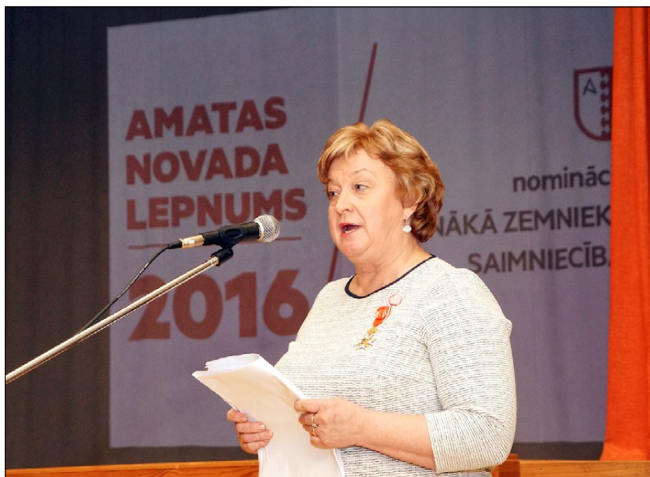
Amatas novada domes priekšsēdētāja Elita Eglīte.