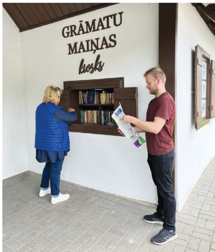
Attēlā: Taurenes pieturā tagad ir izvietots grāmatu maiņas kiosks un informatīvs stends, kas stāsta par pagastu.

Taurenes autobusu pietura nu kļuvusi par vietu, kas stāsta par Taureni. Par to, ka te ganījušies tauri un kāds ir bijis tilts pār Gauju. Tā stāsta par Bānūžu svētavotu, par Nēķena muižu un seno Taurenes vēsturi.