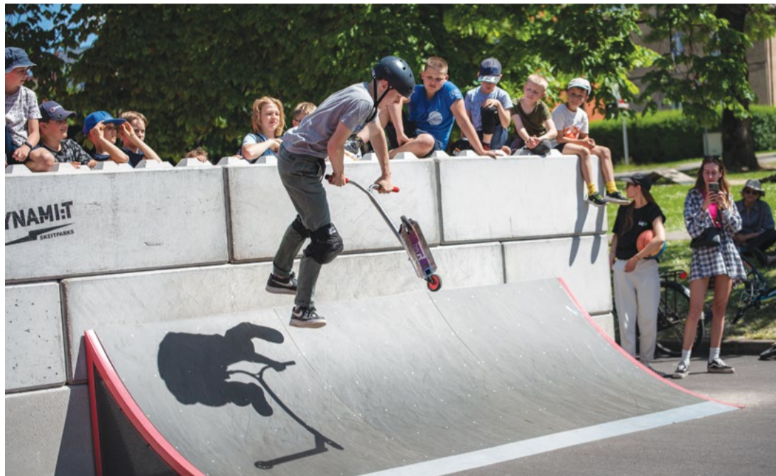
Attēlā: Jaunajā skeitparkā izveidota krāsaina un droša vide pārgalvīgiem trikiem.

Pateicamies uzņēmējiem, kuri atbalstīja Cēsu skeitparks renovāciju! AS "Cēsu alus" nodrošināja līdzfinansējumu, SIA "8 CBR" asfalta rūpnīca