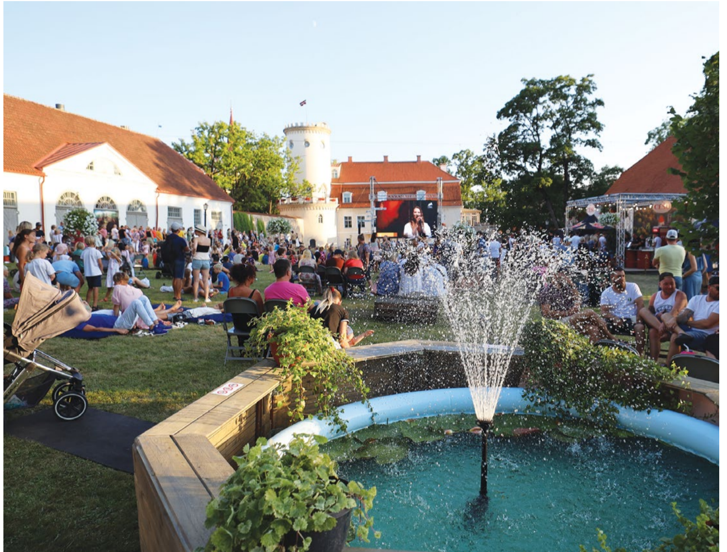
Attēlā: Daudzveidīgajām svētku norisēm cēsnieki varēs sekot klātienē, bet koncertiem arī tiešraidē ReTV televīzijā.