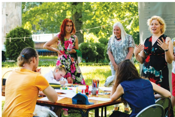
Attēlā: Priekuļu svētki jūnijā piedāvāja gana plašu programmu dažādām paaudzēm un dažādām gaumēm.

Par to liecināja arī lielā skatītāju atsauce.