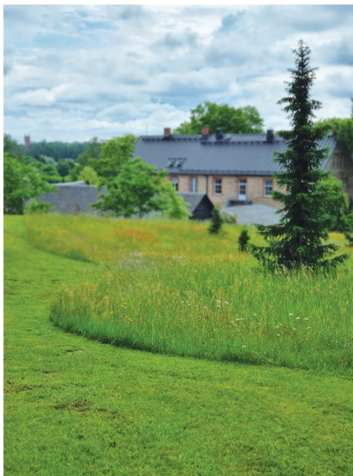
Attēlā: Dabīgās pļavas ir nozīmīga, taču reta Vidzemes augstienes ainavas sastāvdaļa.