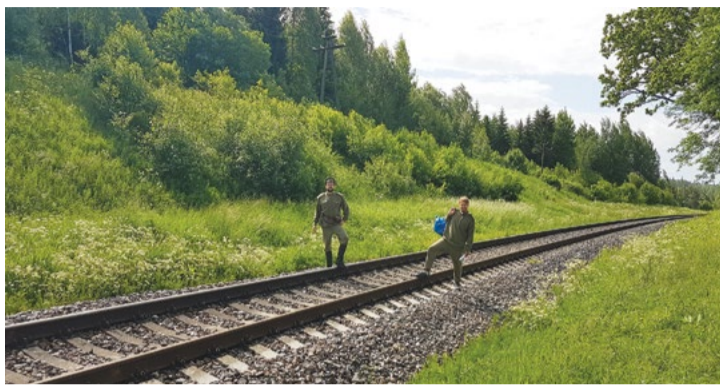
Attēlā: Pirms Jāņiem pie Amatas tilta uzņemta epizode, kas attēlo pirmo Cēsu aizstāvju un Landesvēra spēku sadursmi.

Projekta īstenošanā iesaistījusies arī Amatas apvienības pārvalde. Kā pastāstīja projekta koordinatore Ieva Dreibante, leriņu dzelzceļa stacijas tuvumā paredzēts uzstādīt stacionāru virtuālās realitātes binokli, kurā ielūkojoties, ceļotāji varēs noskatīties Cēsu kauju epizodi. Pirms Jāņiem sāks audiovizuālā materiāla filmēšana. Epizode ataino pirmo Latvijas – Igaunijas apvienoto spēku sadursmi ar vācu karavīriem pie Amatas tilta. Igaunņu bruņuvilciens "Kalev", kurā bija arī Cēsu skolnieku rotas puīši, 5. jūnijā devās izlūkbraucienā uz leriņiem, un pie Amatas tilta notika apšaušana ar vācu spēkiem. Nākamajā dienā