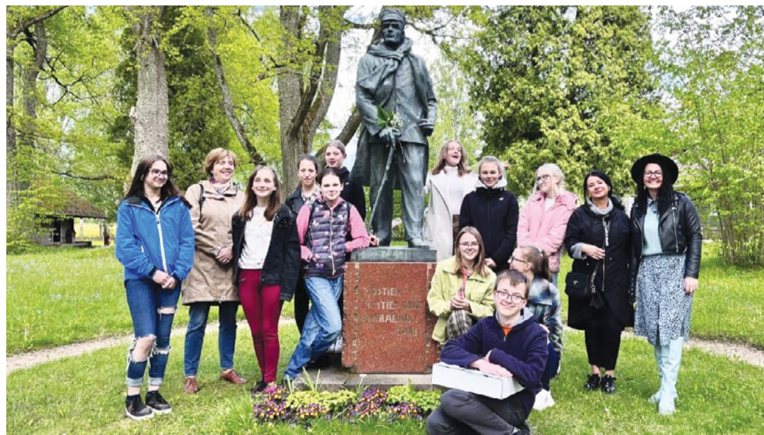
Attēlā: Jaunpiebalgas Mūzikas un mākslas skolas audzēkņi izveidojuši gleznu izstādi, iedvesmojoties no Eduarda Veidenbauma dzejas.