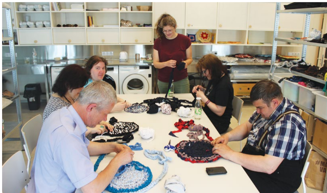
Attēlā: Dienas aprūpes centra "Pērle" specializētajās darbnīcās top dažādu krāsu un sa-režģitības pakāpes rokdarbi.