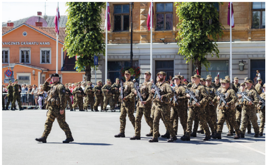
Militārajā parādē Vienības laukumā braši soļoja karavīri un zemessargi no Latvijas, Igaunijas un NATO paplašinātās klātbūtnes kaujas grupas.

Cēsu novada saistošo noteikumu pilns atspoguļojums turpmāk cesis.lv un Latvijas Vēstnesī vestnesis.lv/ta/pasvaldibas/cesu-novada-dome