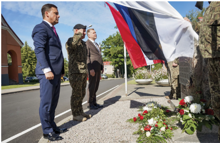
Cēsu novada domes vadība un bruņoto spēku virsnieki piemiņas brīdī pie pieminekļa Cēsu pulka Skolnieku rotas cīnītājiem.