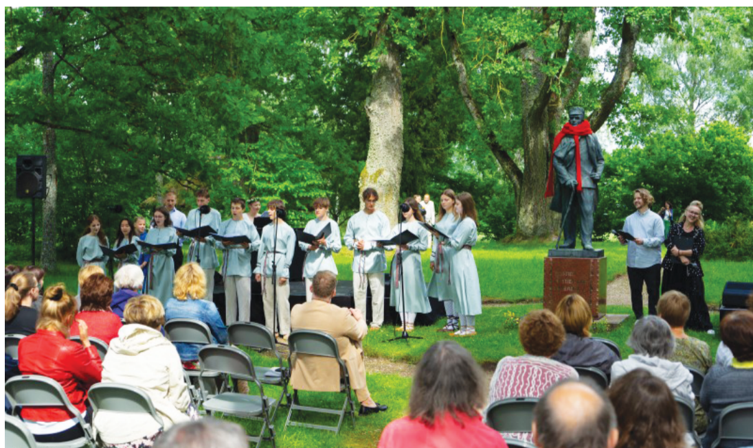
Attēlā: Svinīgā ceremonijā, kas norisinājās Eduarda Veidenbauma "Kalāčos", Latvijas Muzeju biedrības Gada balvu šogad saņēma Ziedoņa muzejs.

Jūnija sākumā norisinājās Latvijas Muzeju biedrības Gada balvas pasniegšanas ceremonija. Galveno balvu šogad saņēma Ziedoņa muzejs un tā jaunais piedāvājums – individuālā apmeklējuma programma "Muzeja ceļa piezīmes". Šogad laureātus un