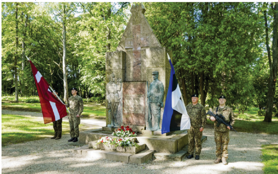
Latviešu un igauņu goda sardze Lejas kapos pie pieminekļa Pirmajā Pasaules karā un Latvijas Brīvības cīņās kritušajiem karavīriem.