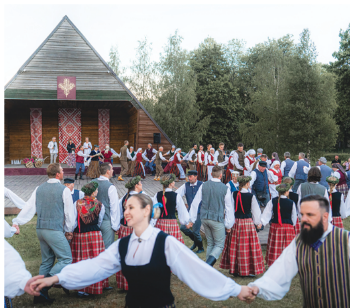
Attēlā: Svētku "Skujene skan!" kulminācija bija tautas deju kolektīvu sadancošanās Skujenes estrādē.