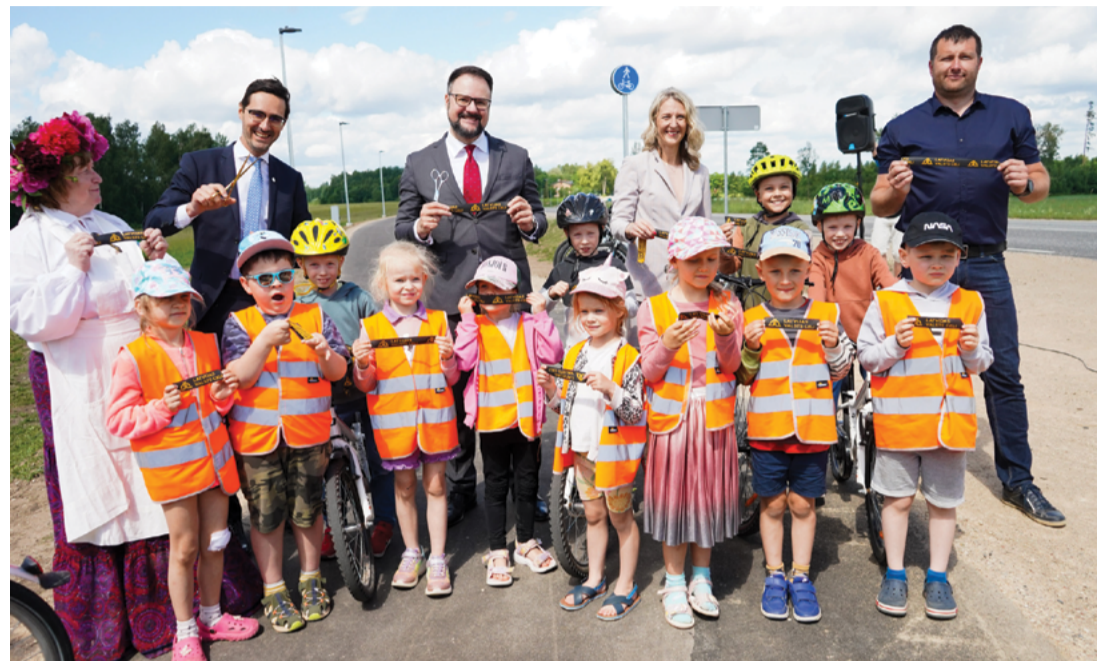
Attēlā: Priecīgs notikums lieliem un maziem, atklāts drošs un gaišs gājēju un velobraucēju celiņš Cēsis – Līvi!

Jūnija sākumā svinīgi atklāta jaunā gājēju un velo infrastruktūra no Cēsīm līdz pagriezienam uz Līviem.