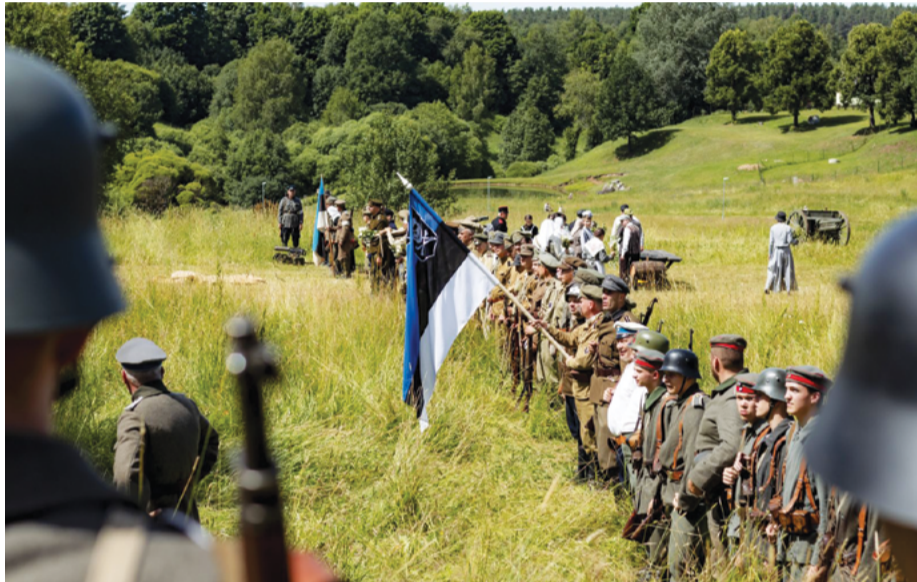
Vērienīgajā Cēsu kauju rekonstrukcijā Pirtsupītes gravā piedalījās kauju atveidošanas entuziasti no visām Baltijas valstīm.

Ziemeļlatvijas armijai un igauņiem ir lieli spēki. [...] Daudziem karavīriem vaiņagi kaklos, jo šodien ir Jāņu vakars. Ziedi sprauti šauteņu stobros, karavīru sejas smaidošas, lai gan paši gurdeni, putekļiem klāti. Dzied bez mītešanās mūsu karavīvi. Tautas dziesmas un arī brašo "Pumpiņ rasa". Nu atkal mēs ticam latviešu un igauņu vienotai uzvarai."