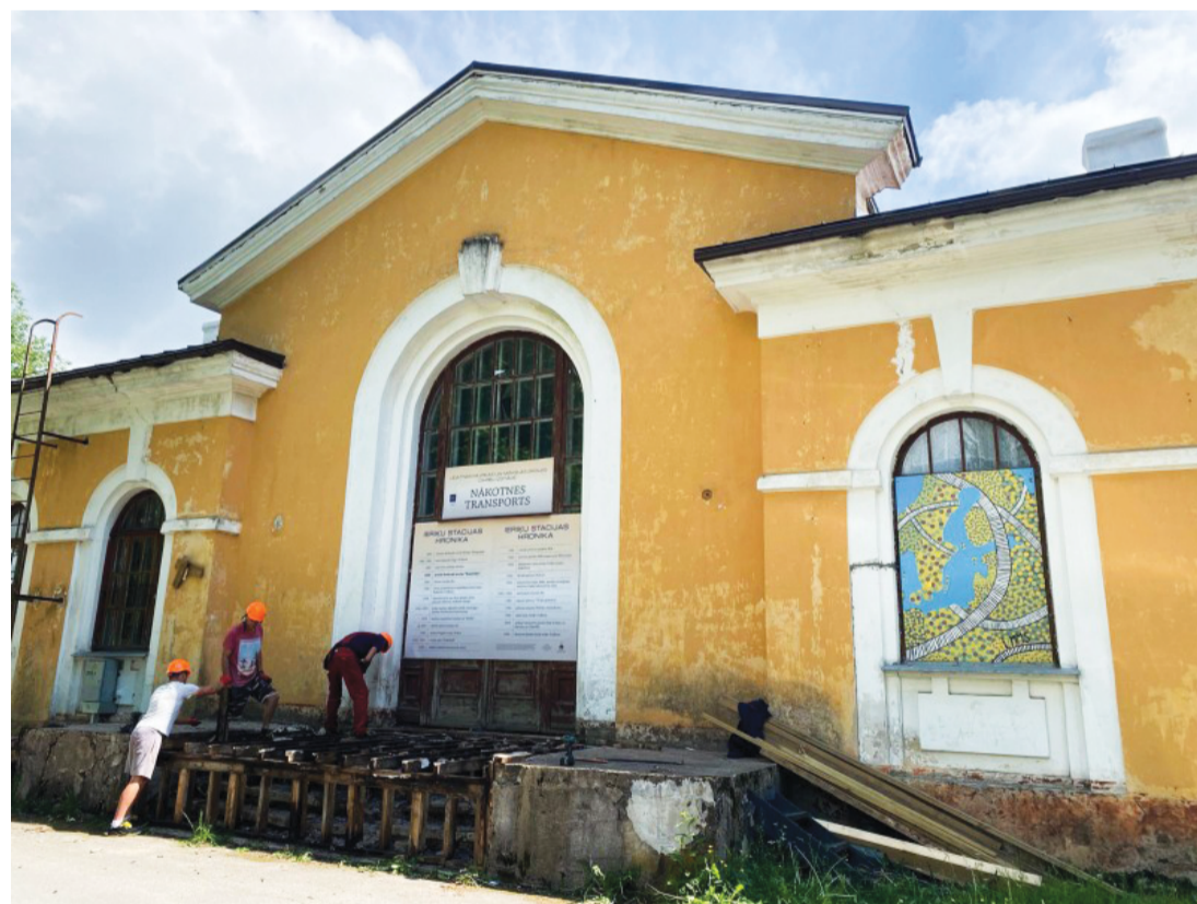
Attēlā: Sākti leriņu stacijas ēkas atjaunošanas un siltināšanas būvdarbi. Tiem noslēdzoties, ēka kļūs par leriņu vietējās kopienas sabiedrisko un kultūras centru.

Lai izveidotu telpas leriņu vietējās kopienas kultūras un citām sabiedriskajām aktivitātēm, sākti būvdarbi pašvaldības ēkas "leriņu stacija" leriņos, Drabešu pagastā, energoefektivitātes paaugstināšanai.