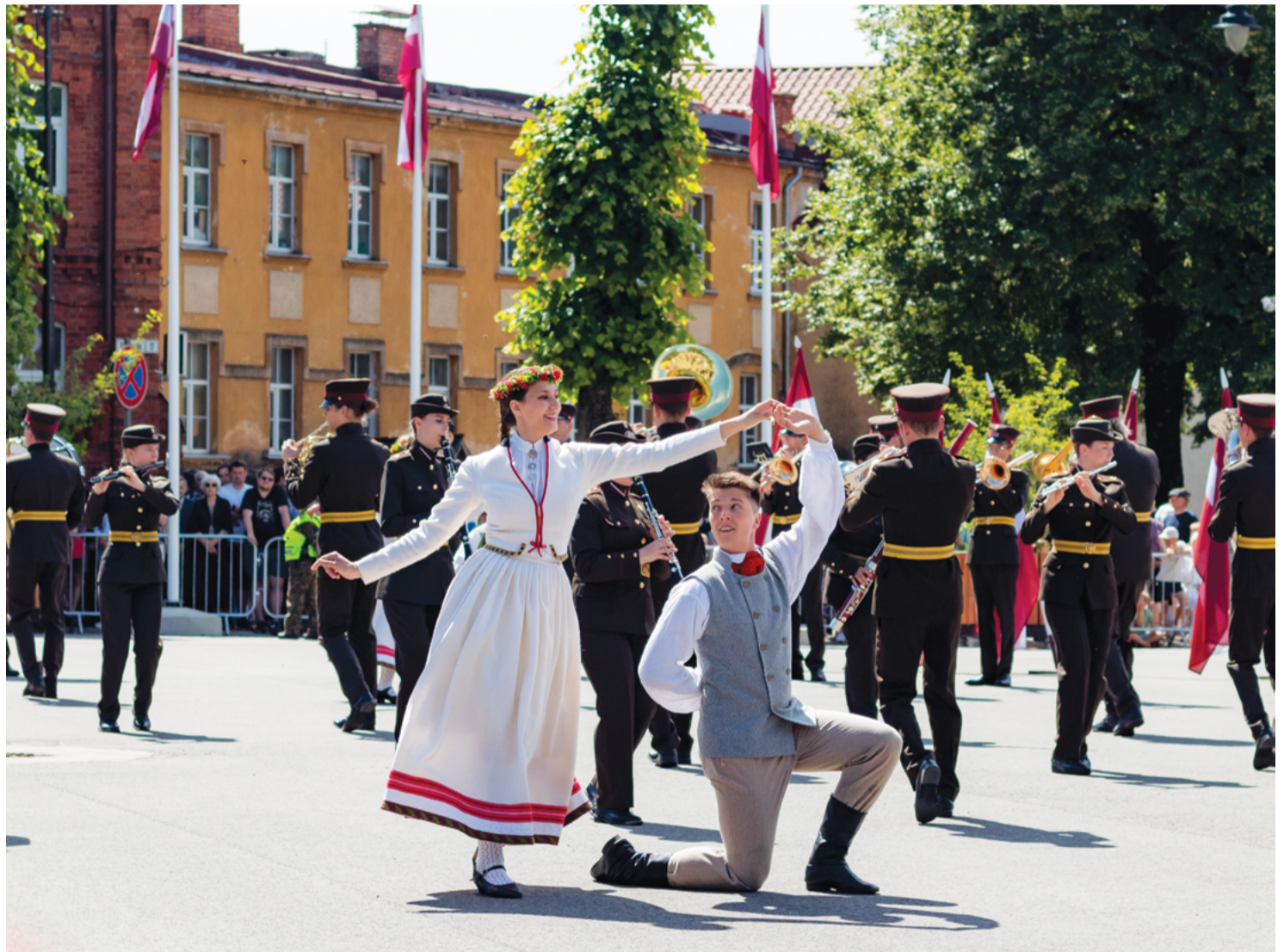
Attēlā: Cēsu kauju 105. gadadienā Vienības laukumā skatītāji varēja vērot Latvijas un Igaunijas karavīru parādi, Zemesardzes orķestra defilē programmu un dejojāju priekšnesumus.

“Mēs labi saprotam, ka gatavībai cīnīties par savu brīvību un neatkarību ir jābūt vienmēr. Mēs labi redzam, kas šobrīd notiek Eiropā. Mēs labi redzam Krievijas agresiju pret Ukrainu. Mēs labi redzam to, ka mūsu neatkarība un brīvība ne visiem ir pa prātam. Bet gan šodien, gan ikdienā mēs apliecinām gatavību to aizstāvēt atkal un atkal. Mēs neesam vieni. Ar mums ir kopā mūsu NATO sabiedrotie, ar mums ir kopā mūsu Eiropas partneri,