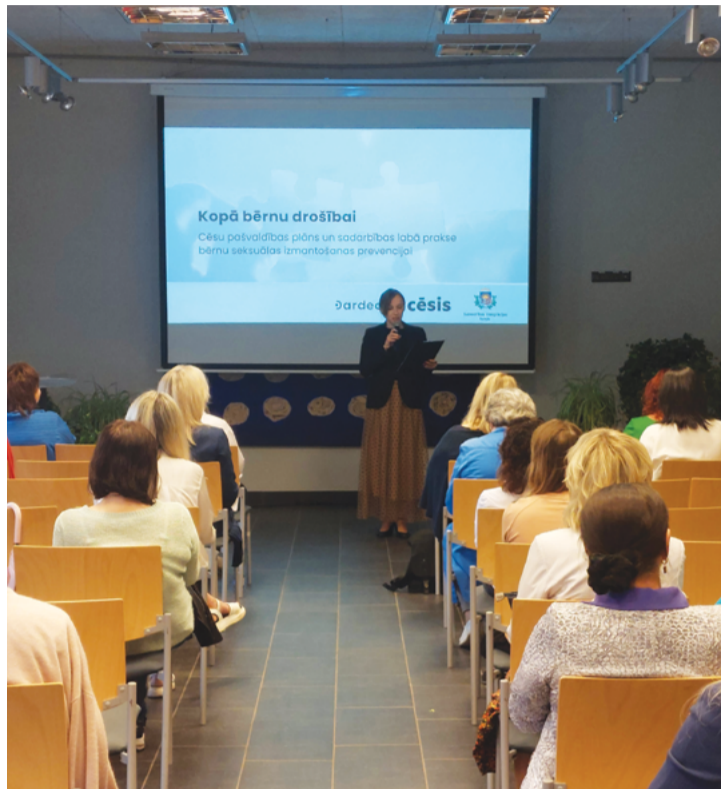
Attēlā: Konferencē, kas veltīta bērnu drošībai, prezentēja Cēsu novada topošo prevencijas plānu, lai novērstu bērnu seksuālas izmantošanas riskus.

Sociālais dienests 2023. gada nogalē kopā ar Izglītības pārvaldi, Bāriņtiesu, Pašvaldības un Valsts policiju uzsāka novada pašvaldības plāna bērnu seksuālas izmantošanas prevencijai izstrādi. Tas ietvēra