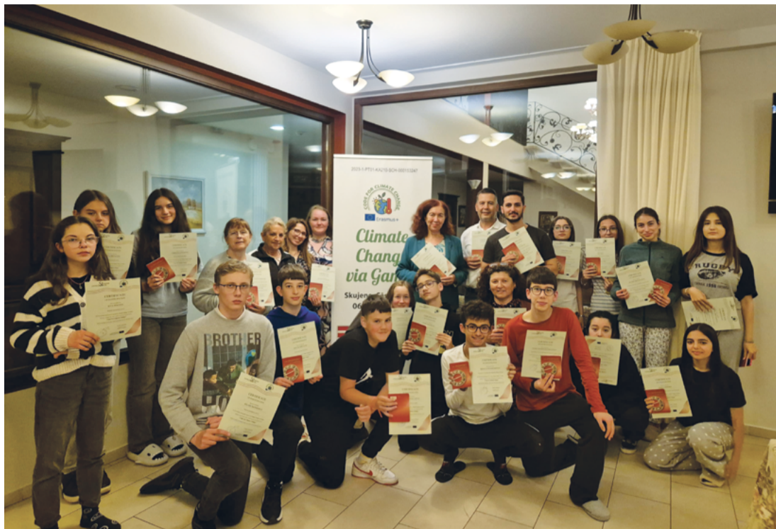
Attēlā: Skujenes pamatskolas skolēni uzņēma viesus no Portugāles un Serbijas, lai kopā mācītos programmēt spēles par klimata pārmaiņu ietekmi uz vidi.

Maijā Latvijā, Skujenes pamatskolā, notika skolēnu pirmā tikšanās. Skolēni programmēja spēles, kuru galvenā ideja bija rast risinājumus, kā mēs varam