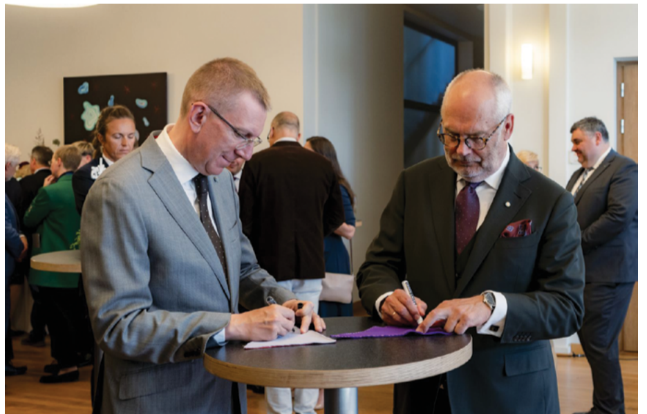
Latvijas un Igaunijas prezidenti Edgars Rinkēvičs un Alars Kariss atstāja savus novēlējumus uz Cēsu svētku karodziņiem.