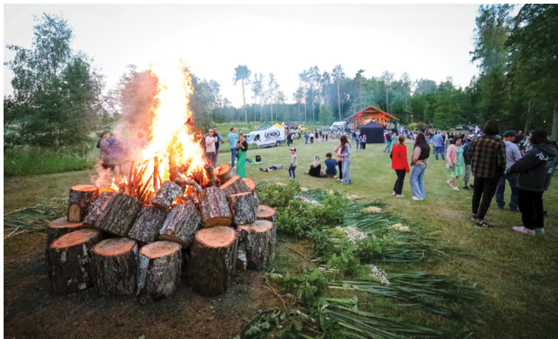
Foto: Priekuļu apvienības svētkos, kas šogad norisinājās Mārsnēnos, bija gan saule, gan ēna, gan kārtīgs ugunsurs un balle ar dejām līdz rīta gaismai.

Šoreiz svētkiem bija izvēlēts moto: "Ja ir ēna, tad kaut kur ir arī Saule". Saule, kas ir arī Priekuļu apvienības logo zīme, simbolizē gaismu un siltumu, bet ēna veldzē un atvēsina. Kad ir karsti, ēnai ir veldzējoša nozīme. Tāda ir arī svētku būtība – veldzēties priekā un labās emocijās. Katram kokam ir ēna, katram taurenim sava spārnu ēna. Mārsnēnu apkaime ir bagāta ar mitrājiem un ir viena no lielākajām purva