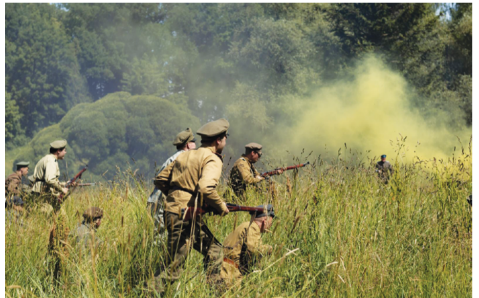
Šāvieni, sprādzieni, dūmu mutuļi un niknas cīņas... Viss kā īstā kaujā.