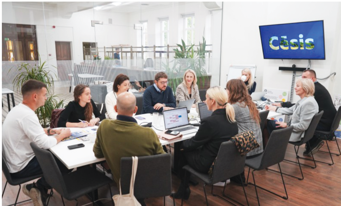
Attēlā: Speciālisti no dažādām pasaules valstīm dalījās pieredzē klimata rīcības plāna īstenošanā.

Lai sekmētu pieredzes apmaiņu un stiprinātu starptautisko sadarbību enerģijas un klimata rīcības plāna īstenošanā, novada pašvaldībā notika starptautisks pasākums, kurā piedalās pārstāvji no dažādām valstīm, tostarp no Portugāles, Ukrainas, Armēnijas un Moldovas.