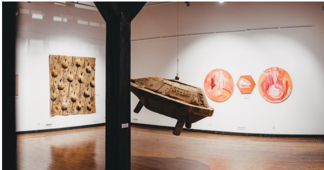
Attēlā: Cēsu novada mākslas gada balvas darbu izstādē skatāmi 36 novada mākslinieku darbi.

“Cēsu novada mākslas gada balva” ir kultūras nozares tradīcija, kas aizsākta 2020. gadā. To īsteno Cēsu muzeja Izstāžu nams sadarbībā ar Cēsu novada pašvaldību. Konkurss-izstādes mērķis ir izgaismot profesionālo mākslinieku veikumu un sniegt atbalstu radošajā darbā. Visus iesniegtos mākslas darbus vērtēs žūrija – pieaicināti profesionāli mākslas nozares darbinieki. Konkurss noslēgumā tiks piešķirtas balvas: viena Zelta, divas Sudraba un Skatītāju