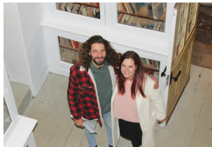
Attēlā: Arī "Leģendu nakti" oktobra beigās Lielstraupes pils bija ļoti apmeklēta.

tikšanās bija labi apmeklēta, un raisījās saturīgas diskusijas gan par pastaigu takām, gan stāvlaukuma izveidi. Bija interese arī par uzņēmējdarbību islaicīgai noma paredzētās telpās pili un tās apkārtnē. Bija interesantas diskusijas par to, kāda stila kafējnīca jāveido pili. Uzņēmējiem bija pamatoti jautājumi par telpu nomas termiņiem, jo kafējnīcas vai naktsmītņu izveide prasa nopietnus ieguldījumus, kas var atmaksāties, ja ir ilgtermiņa nomas iespējas.