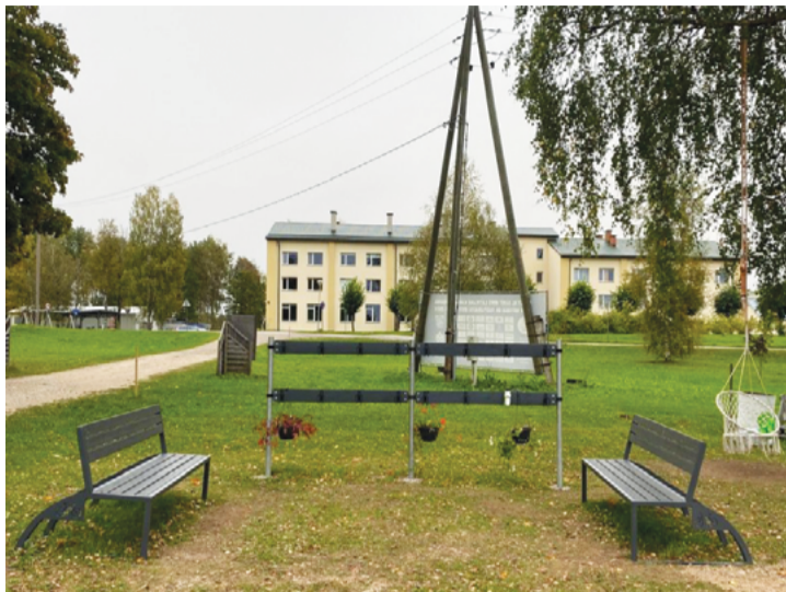
Attēlā: Kopienas iniciatīvu konkursa rezultātā labiekārtota BMX trases apkārtnē Vecpiebalgā.

Pateicoties projekta īstenošanai, BMX trases vide ir pielāgota sportistu vajadzībām un ērtībām, ko augstu novērtēja gan 20. jūlijā notikušā "Crystal