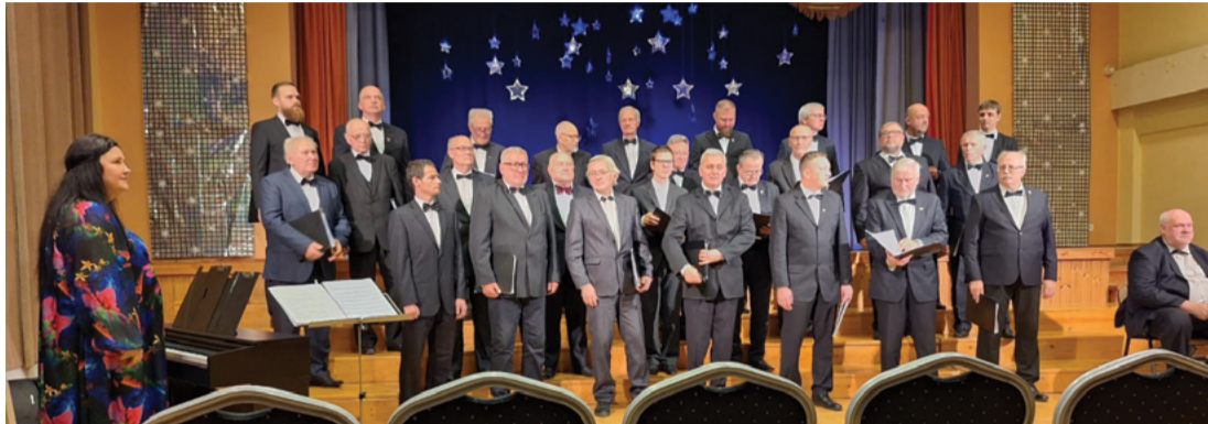
Attēlā: Amatas vīru kora "Cēsis" 45 gadu jubilejas koncerts sākās ar gaviļnieku dziedātām kolektīva "zelta fonda" dziesmām.