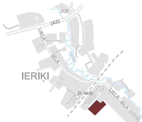
LOKĀLPLĀNOJUMA TERITORIJAS ATRAŠANĀS VIETA